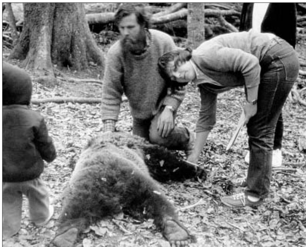
Uscheprest che l'urs è narcotisà vegn el intercurri ord diversas opticas. Plinavant vegn el mesirà e sche necessari vegni mess en ad el in cularin-emettur.