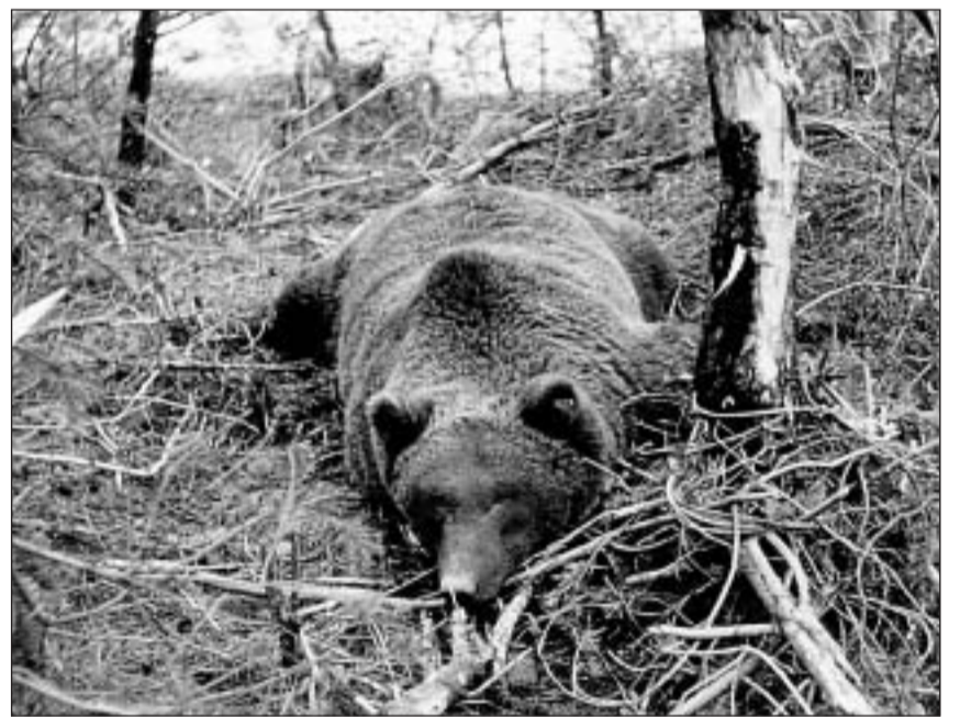
Sche l'urs vegn piglià per motivs da perscrutaziun en in latsch da pes elastic, sche sa dosta el zuar vehement, vegn dentant narcotisà immediat ord distanza.

La protecciun dals animals suletta na tanscha betg, sch'il spazi da viver vegn a medem temp destrui e parcellà adina dapli tras la civilisaziun da l'uman.