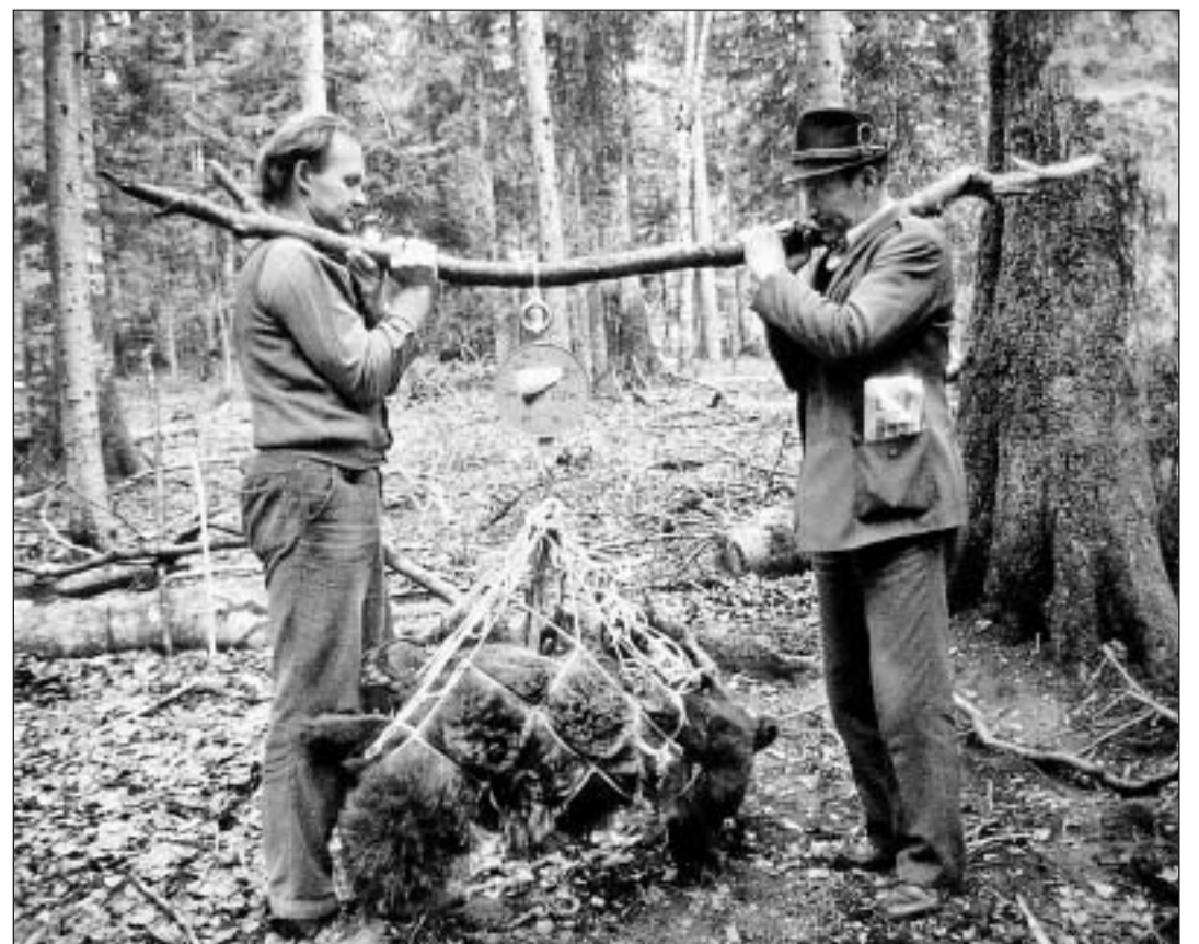
Mintga «urs da perscrutaziun» vegn sa chapescha era pesà, quai che sto succeder en ina cuntrada intransibla cun ils meds ils pli simpels.