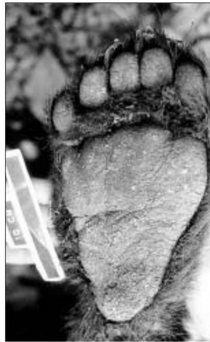
Toppa davos d'in urs brin, vesi da sutsi: Cumpar urs va sin la planta-pe, vul dir: el metta ses pe plat giun plaun.