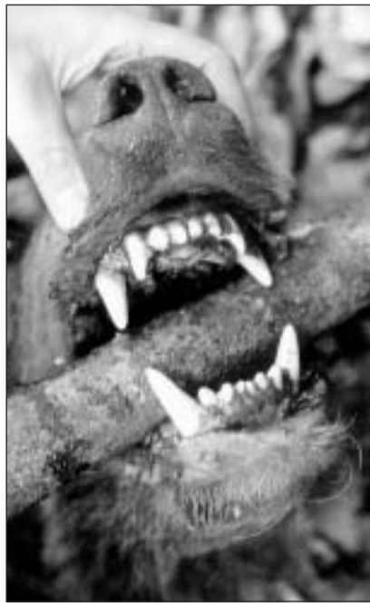
Malgrà sia dentadira da rapina è l'urs brin – cuntrari a luf e luf-tscherver – per 80 ubain anc dapli pertschient vegetari.

Oz, tschient onns pli tard, cumenz'ins en la protecciun da la natira a s'occupar danovamain da la dumonda d'in eventual return da l'urs. Èsi pussaivel che l'urs alpin, che viva oz anc en la regiun dal Trentino en l'Italia dal nord (cf. chascha), mo radund 40 kilometers davent dal cunfin svizzer (Puschlav), returna in di puspè en Svizra? La basa legala fiss dada: La spezia è protegida dapi il 1962.