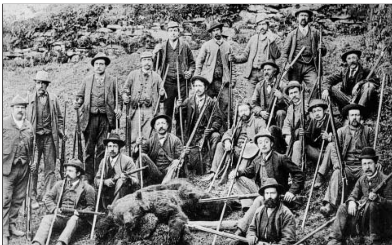
Bliers chatschaders èn la mort da l'urs. Quest purtret d'ina chatscha en il Mesauc vers la fin dal 19avel tschientaner reflectescha la mentalità ch'ins veva lezza giada envers ils animals da rapina.